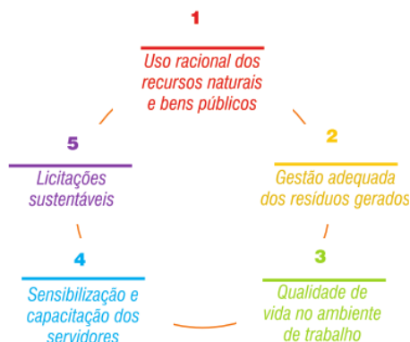
Figura 1 – Eixos temáticos da A3P.

A figura 1 ilustra os eixos temáticos da A3P: