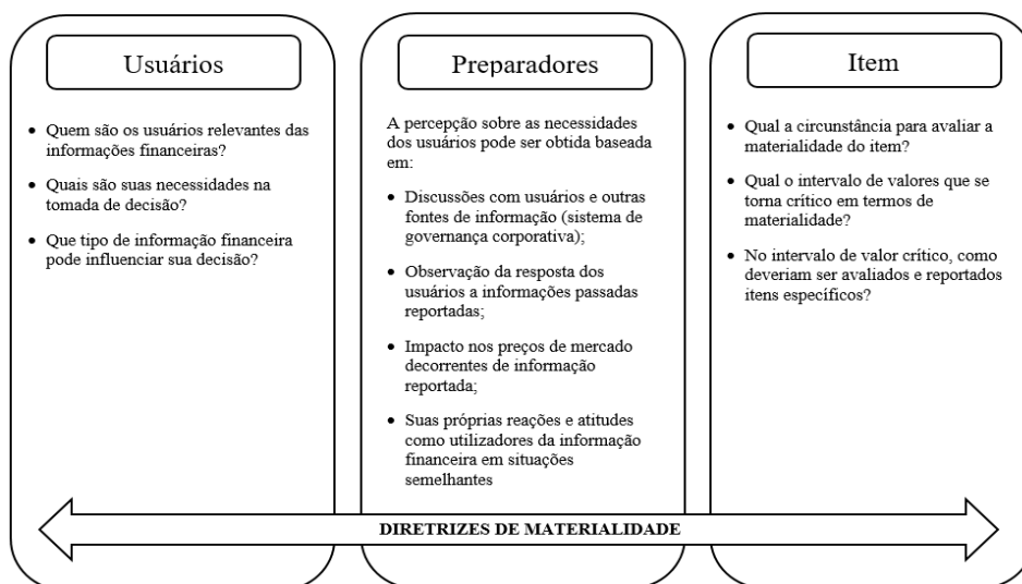
Figura 1 - Diretrizes da materialidade

Ao analisar se as notas explicativas preparadas de acordo com as normas internacionais de contabilidade cumprem o objetivo principal de fornecer informações úteis aos usuários, Souza (2014) apresenta graficamente diretrizes que a gestão das entidades deve observar para a tomada de decisão acerca da materialidade, conforme Figura 1.