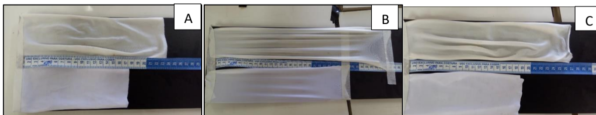
Figura 2 – Imagens do ensaio de alongamento das amostras 1 e 2

Ao analisarmos a elasticidade e capacidade de alongamento, pode-se observar que ambas as amostras (amostra 1 e 3) apresentaram alterações quando comparadas às amostras que não foram submetidas ao processo de lavagem. Se considerarmos que o alongamento em um tecido é capacidade do tecido de alterar suas dimensões mediante uma força e retornar ao tamanho original (ABNT NBR 12960), podemos concluir que ambas as amostras foram reprovadas no teste. A Figura 2 apresenta as fotos que ilustram a etapa métrica dos tecidos. Na Figura 1a nota-se os corpos de prova 1 e 2 no início do experimento. A figura 2b representa os corpos de prova sendo submetidos ao alongamento. A Figura 2c apresenta os corpos de prova depois do alongamento. Nota-se que ambas não voltam para o tamanho inicial. Entretanto o corpo de prova 1 que representa o tecido após 30 lavagens apresenta um resultado pior no teste de alongamento do que a amostra 3.