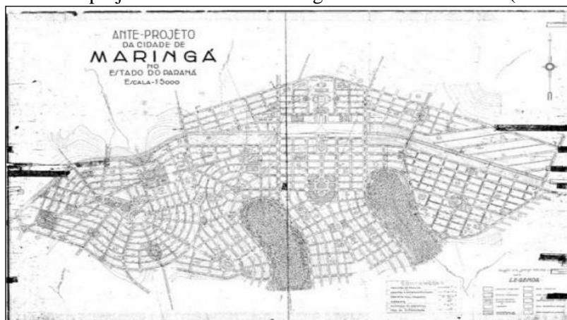
Figura 1 - Anteprojeto da cidade de Maringá no estado do Paraná (década 1940)