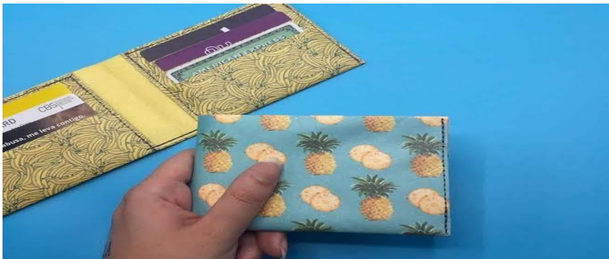
Figura 2 – Carteira de papel (DOBRA, 2020)