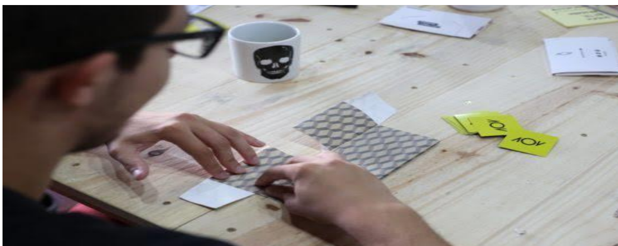
Figura 3 – Construção da carteira de papel (DOBRA, 2020)