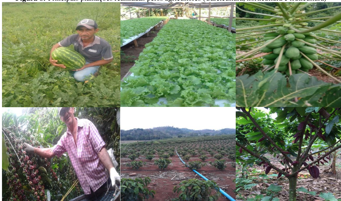
Figura 8: Principais plantações realizadas pelos agricultores (Cafeicultura, horticultura e fruticultura)

Conforme Saquet (2014) os métodos alternativos na agricultura prezam essencialmente pela preservação da biodiversidade, aproveitando os sinergismos próprios dos componentes biológicos e dos recursos de cada unidade produtiva, trabalhando com controle biológico de pragas, manejo adequado que garanta matérias orgânicas para nutrição da planta, reciclando nutrientes e matérias orgânicas.