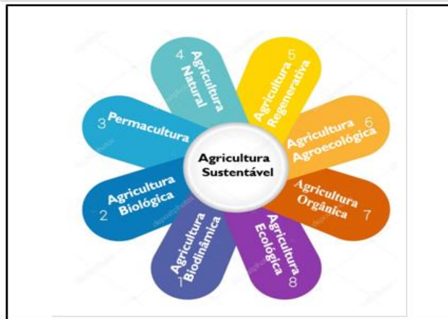
Figura 3: Métodos Sustentáveis Aplicados na Agricultura

Segundo Kamiyama (2011) o desenvolvimento de tecnologias e políticas voltadas para a adoção de técnicas de produção mais sustentáveis é essencial para fomentar novos mercados, aprimorar a renda dos agricultores e garantir a segurança alimentar da população. Neste sentido, fazem parte da agricultura sustentável os seguintes métodos aplicados na agricultura (figura 3):