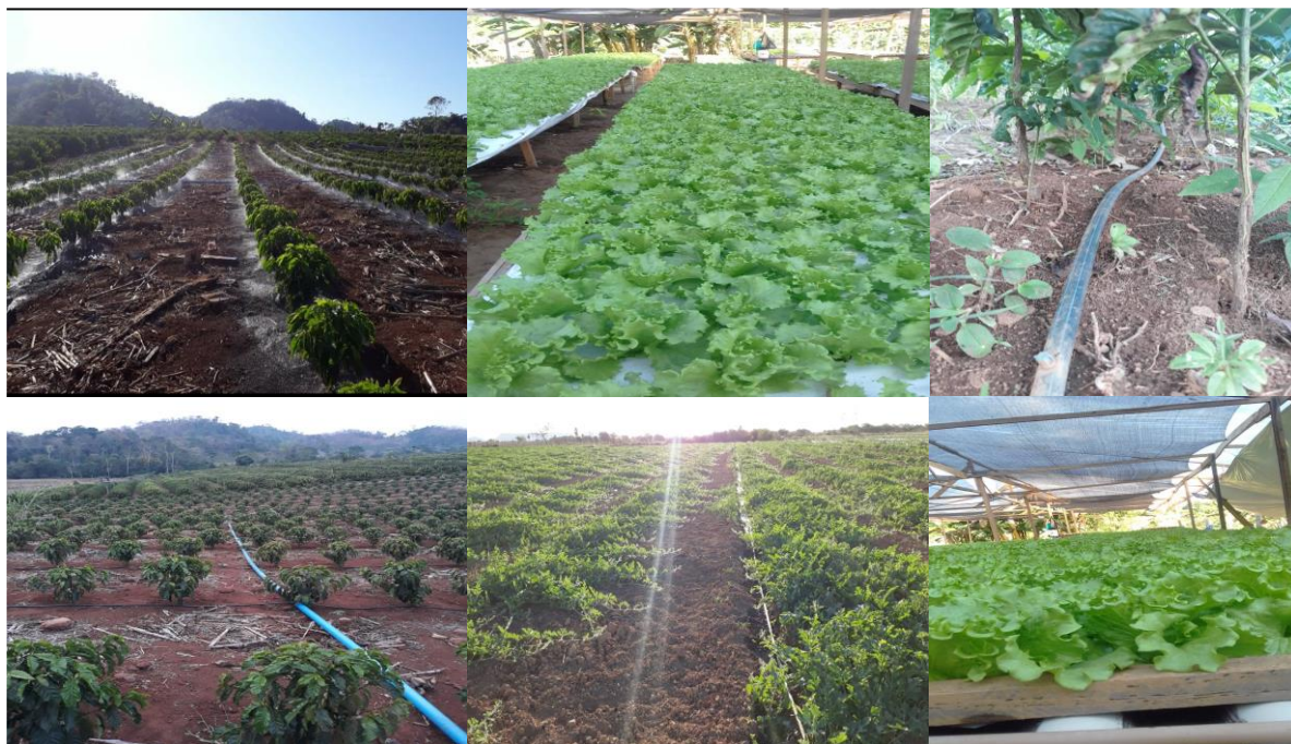
Figura 10: Principais plantações com irrigação dos produtores

Entre as tecnologias mais utilizadas pelos agricultores destacam os sistemas de irrigação elétrica, Bomba e roçadeira motorizadas, mudas com qualidade melhorada e os insumos agroquímicos. Dos agricultores entrevistados 85% utilizam pelo menos três das tecnologias mencionadas no processo de produção. Os produtores ainda não usufruem de todas as tecnologias devido à falta de recursos financeiros, ou em muito dos casos desconhecem tais mecanismos para aprimorar a produtividade. A figura 10 evidencia o uso do principal mecanismo tecnológico (irrigação elétrica) nas atividades produtivas dos agricultores familiares da associação ASPROGRECO.