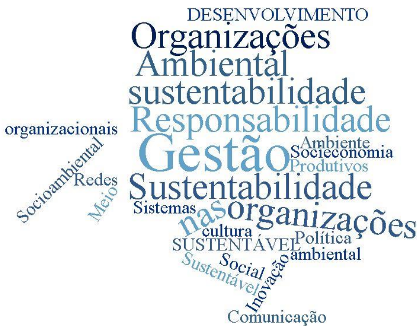
Figura 1 – Nuvem de Palavras Disciplinas

A partir da metodologia mencionada, analisaram-se os projetos de 4 universidades que disponibilizaram todos os dados possíveis para que a discussão fosse realizada. São 3 programas com conceito 4 e 1 programa com conceito 3.