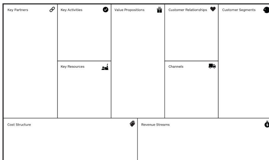
Figura 1. Business Model Canvas

Na subseção sobre modelos de negócio serão apresentadas as diversas propostas de classificações de modelos de negócio da economia circular. Esses estudos têm como referência o Business Model Canvas , uma ferramenta de gerenciamento estratégico proposta por Osterwalder e Pigneur (2013) e que é composta por um quadro dividido em nove categorias analíticas: atividades-chave, canais, estrutura de custos, fonte de receitas, parcerias-chave, proposta de valor, recursos-chave, relacionamento e segmento de clientes – figura 1.