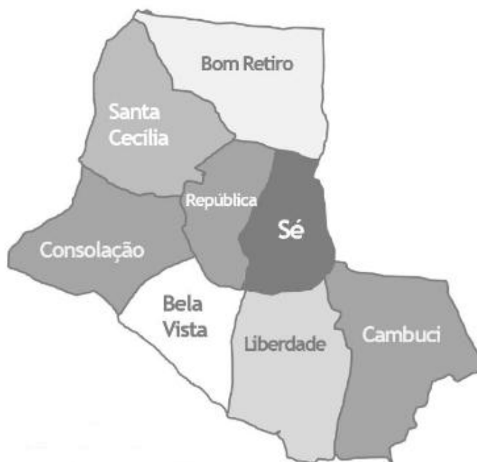
Figura 1 – Área da Subprefeitura da Sé e Distritos.