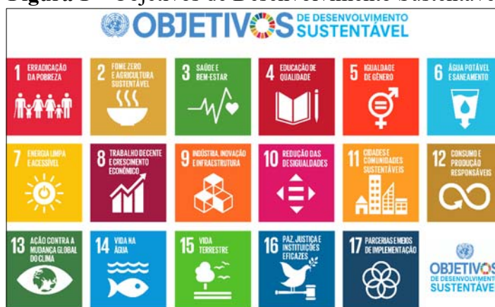
Figura 1 – Objetivos de Desenvolvimento Sustentável

Os Objetivos de Desenvolvimento Sustentável (ODS) são um apelo global à ação para acabar com a pobreza, proteger o meio ambiente, o clima e garantir que as pessoas, em todos os lugares, possam desfrutar de paz e de prosperidade. São 17 objetivos, 169 metas e indicadores, constituindo um plano de ação de prosperidade para o planeta e a sociedade global, conforme ilustra a Figura 1 .