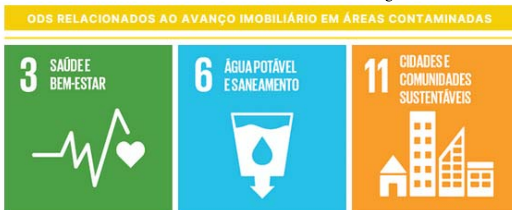
Figura 2 – Principais ODS relacionados ao avanço imobiliário em áreas contaminadas, de acordo com a análise realizada na Plataforma Agenda 2030.

tema abordado e se há algum indicador que permite a avaliação da prática de desenvolvimento imobiliário em áreas contaminadas no Brasil, em particular, em São Paulo.