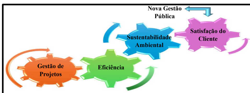
Figura 1 - Diagrama conceitual do funcionamento da Teoria da Nova Gestão Pública