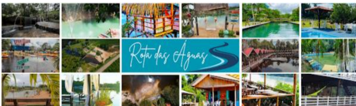
Figura 1. Balneários que compõem a Rota das Águas em Porto Velho-RO.