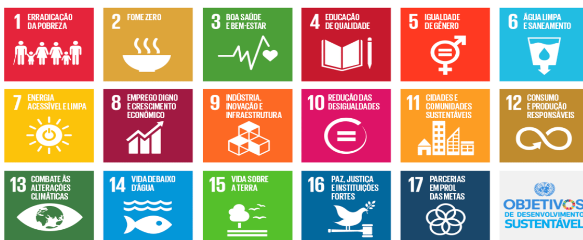
Figura 1 – Objetivos de Desenvolvimento Sustentável (ODS)

Primeiramente, foi realizada a definição do escopo e identificação das dificuldades relacionados a aplicação da metodologia ágeis, a qual se fundamenta nas metodologias e frameworks ágeis apresentados no capítulo referente ao estado da arte. Tanto o evento quanto a proposta têm como objetivo gerar impacto positivo na sociedade. Na Figura 1, são apresentados os Objetivos de Desenvolvimento Sustentável da Organização das Nações Unidas (ONU), inicialmente ilustrados em seus 17 eixos.