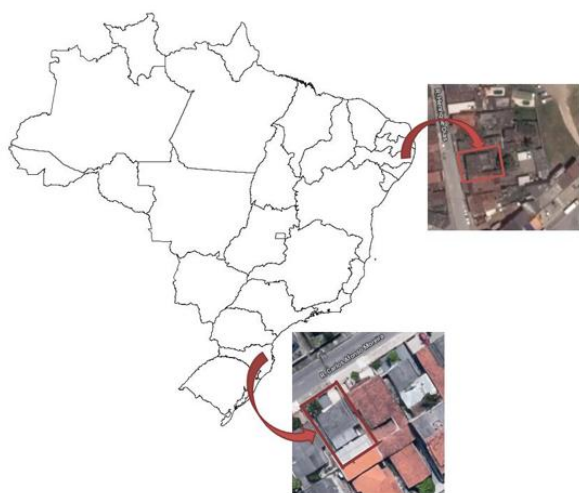
Figura 1 - Localização das residências do estudo de caso original

No estudo original realizou-se uma análise quantitativa para comparar a viabilidade de sistemas fotovoltaicos em duas localidades com perfis climáticos e geográficos distintos. O estudo de caso foi centrado em duas residências unifamiliares, uma em Joinville (SC) e outra em Vitória de Santo Antão (PE), cujas localizações são apresentadas na Figura 1. Os principais resultados que fundamentam a análise original estão consolidados no Quadro 1.