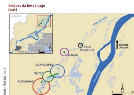
Figura 1- Mapa das comunidades Autor: FIOCRUZ

A RESEX Lago do Cuniã configura-se como uma Unidade de Conservação de Uso Sustentável, localizada na Bacia Hidrográfica do Rio Madeira, na zona rural do município de Porto Velho, estado de Rondônia. No interior da RESEX, residem aproximadamente 400 pessoas, distribuídas em 83 famílias organizadas em quatro núcleos comunitários: Pupunhas, Neves, Silva-Lopes e Araçá, além da localidade de Bela Palmeira, habitada por uma família.