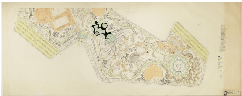
Figura 2 - Croqui detalhado do Parque Moça Bonita, destaque para os diferentes equipamentos naturais e urbanos dispostos no projeto