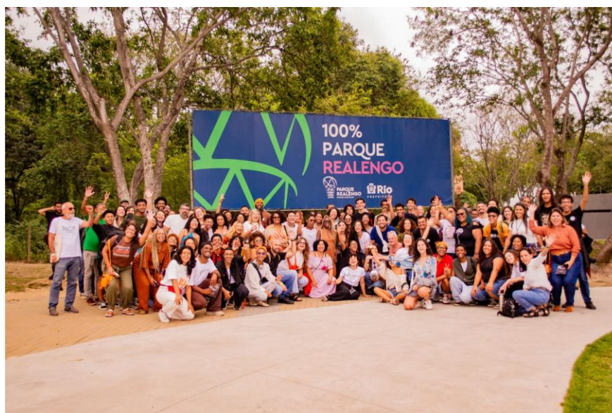
Figura 4 - Movimento 100% Parque Realengo celebrando a implementação do PRSN

O Parque Moça Bonita foi anunciado como uma solução para a falta de áreas de lazer em bairros periféricos, mas sua implementação foi inviabilizada por disputas judiciais e falta de recursos (Jornal do Brasil, 1980). O projeto, no entanto, é comparável ao Parque do Flamengo por seu enfoque modernista, mas se destaca por sua intenção de levar o paisagismo de qualidade para a periferia. Em contraste, a implementação do Parque Realengo mostra que a mobilização social pode concretizar projetos de grande porte, mesmo após décadas de luta (Távora; Baptista, 2025).