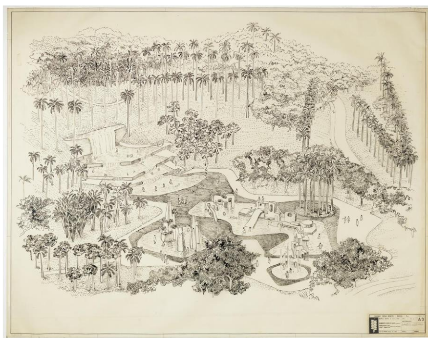
Figura 1 - Croqui do Parque Moça Bonita, desenho detalhado por Roberto Burle Marx

Legenda: Croqui perspectivado por Roberto Burle Marx para o projeto do Parque Moça Bonita, concebido na década de 1980; O desenho, executado em nanquim, expressa a proposta de transformação urbana e ambiental por meio da implantação de um grande parque público, com ênfase na integração entre lazer, natureza e identidade local; A imagem revela um conjunto de elementos paisagísticos e arquitetônicos articulados de forma fluida, com destaque para a vegetação nativa em maciços organizados, espelhos d'água sinuosos, brinquedos aquáticos e uma grande cascata artificial emoldurada por fileiras de palmeiras; As linhas orgânicas e a diversidade espacial refletem a linguagem modernista característica de Roberto Burle Marx, que compreendia o parque como espaço de convivência e valorização do território periférico.