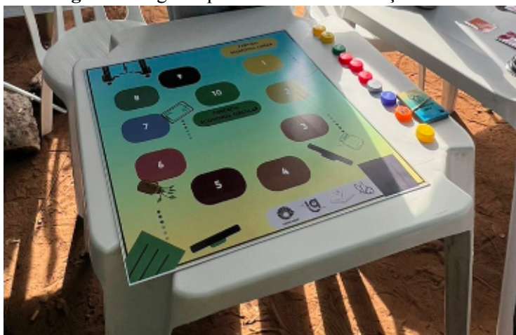
Figura 2: Jogo de percurso no IG na Praça

Com o evento, o ReciclaMente teve a oportunidade de ser articulado com pessoas de diversas faixas etárias (desde crianças com menos de 10 anos até pessoas +60), algumas relacionadas à Unicamp, mas a maioria frequentadores da Praça do Coco e moradores das redondezas. Foram mediados um jogo de tabuleiro que representa caminhos para a saída de uma economia linear e a entrada numa economia circular (Figura 2), e também um jogo da memória com as representações dos ODS.