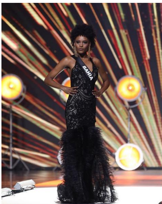
Figura 3. Concurso miss Brasil be emotion 2018.

Um dos destaques importantes do estilista no mercado nacional, foi a sua participação no concurso miss Brasil be emotion , em suas edições do ano de 2018 e 2019, um dos maiores concursos de beleza realizado e televisionado para todo o país. Esse evento possui como representantes mulheres de cada um dos estados brasileiros. Um dos desfiles ocorridos durante o concurso é o de vestidos de gala, desfilado pelas 15 semifinalistas, e esses vestidos durante esses 2 anos foram criados pelo Ivanildo Nunes. Na Figura 3 consegue-se ver um dos modelos desfilados no concurso, trabalhado com as rendas e técnicas cearenses combinadas com outros artigos de luxo como cristais e plumas.