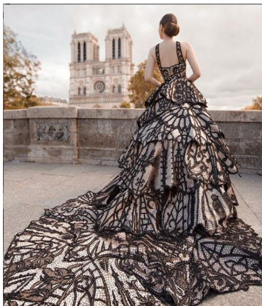
Figura 4. Vestido “Catedral”.