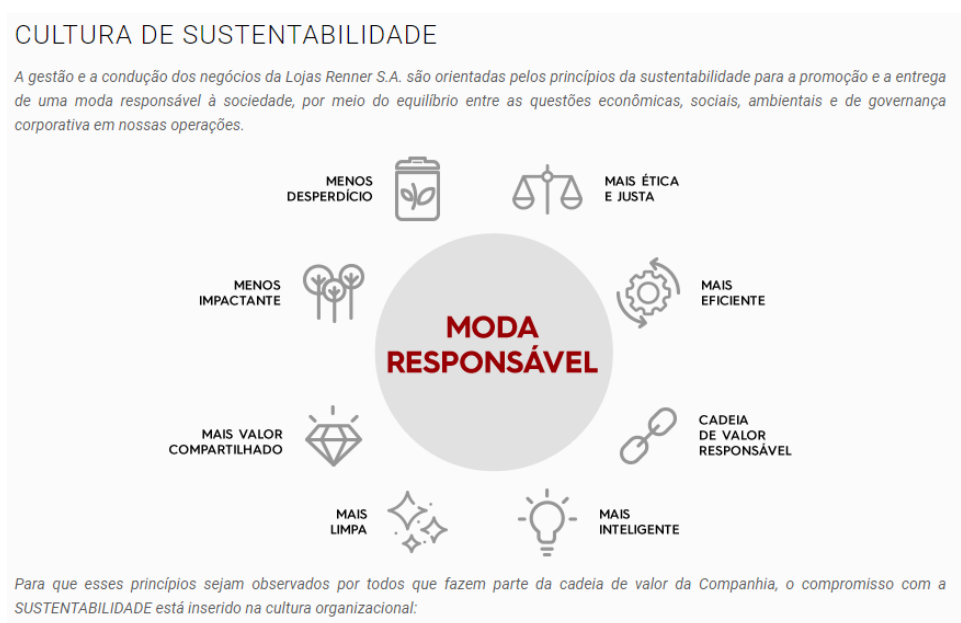
Figura 1. Cultura de sustentabilidade da Renner.

Em relação aos dados coletados com as prioridades propostas na CEO agenda , percebe-se que há a presença dos oito itens prioritários para serem estudados e executados na empresa. Ao entrar no site da Renner, é possível encontrar informações sobre ações sustentáveis que vêm sendo realizadas pela rede, como se pode conferir na Figura 1: