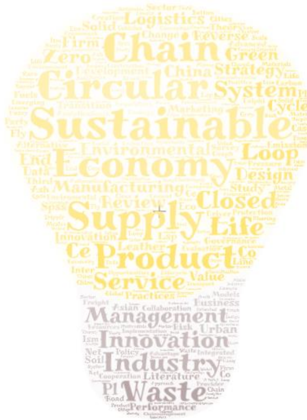
Figura 2: Nuvem de palavras-chave dos artigos da Revisão Sistemática realizada