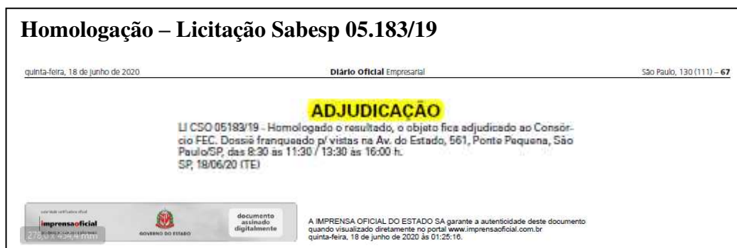
Figura 2: Adjudicação da LI CSO 05183/19