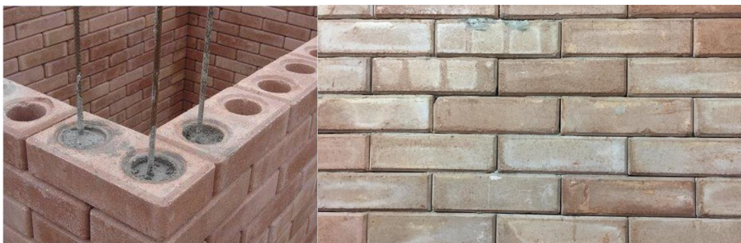
Figura 07: Tijolo Solo cimento da Casa Popular Eficiente da UFSM

III) Tijolo solo cimento: possui bom desempenho, mas também ocorrem dificuldades em fixar suportes, como tomadas ou parafusos, devido ao não comprimento do tempo de cura do tijolo pela empresa fornecedora, causando uma perda em resistência. Junto a isso ocorreu erro na execução nas paredes internas, as quais contam com espaços vazios bem como excesso de argamassa em alguns pontos o que além de causar incomodo visual, deixa transpassar a luz de um cômodo para o outro;