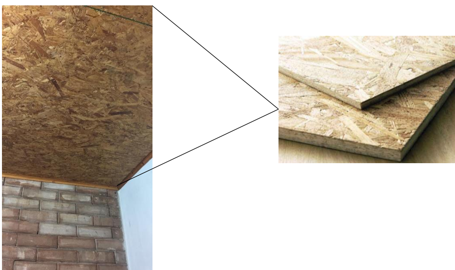
Figura 05: Placa OSB da Casa Popular Eficiente da UFSM

I) Placa OSB: em dias de chuvas intermitentes ou úmidos, vinha a ter problemas com infiltração e surgiam áreas com mofo/bolor, o demonstra a necessidade de uma membrana para barrar o contato com a água, sistema utilizado em construções de Steel Frame ou mesmo o uso de impermeabilizante na placa;