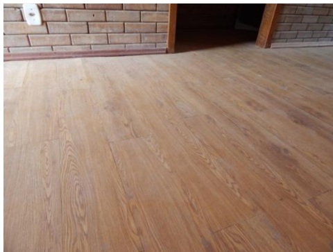
Figura 06: Piso PVC da Casa Popular Eficiente da UFSM.

um espaço considerável entre as laminas o que leva ao acúmulo de sujeira, indicadores que caracterizam erros de execução.