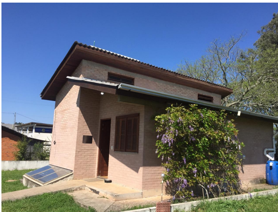
Figura 01: Casa Popular Eficiente, Centro de Eventos, Universidade Federal de Santa Maria.

A Casa Popular Eficiente, localizada no Centro de Eventos da Universidade Federal de Santa Maria, foi construída no segundo semestre de 2013, foi projetada a partir de diferentes desenhos de fachadas e modelos para o protótipo, o projeto consta com 55,42 m 2 de área útil. (KOZLOSKI; VAGHETTI, 2019). A casa é considerada uma prova de que é possível construir moradias populares que contemplem soluções ecológicas com materiais ecoeficientes e economicamente atrativos (VAGHETTI et. al., 2015). Além disso, a casa é muito utilizada para a implantação e testes de pesquisas em diferentes áreas, como conforto térmico (VAGHETTI et. al., 2015b) e acústico (VAGHETTI et. al., 2015a), controle e automação residencial, sanitária e ambiental; a fim de facilitar e alavancar a descoberta de cada vez mais recursos e materiais aplicáveis a um baixo custo.