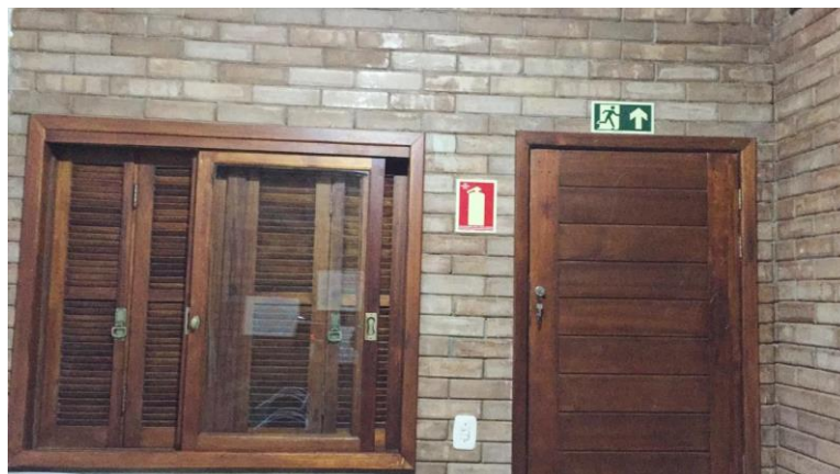
Figura 08: Esquadrias de Eucalipto da Casa Popular Eficiente da UFSM.