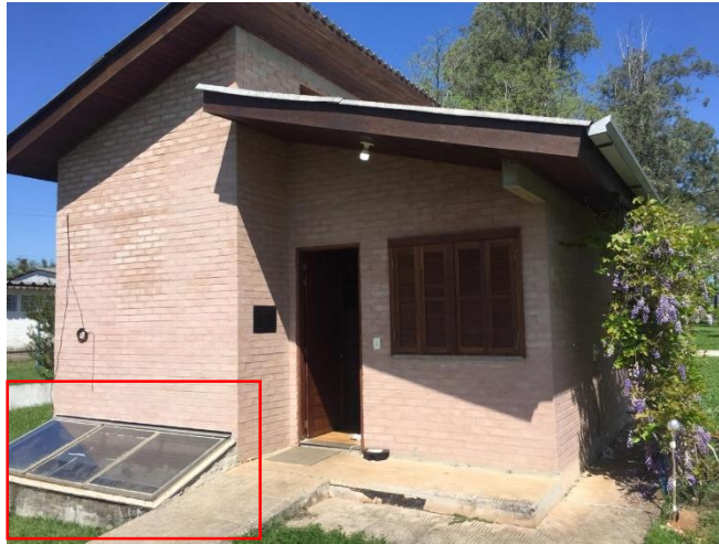
Figura 03: Sistema de Calefação da CPE da Universidade Federal de Santa Maria