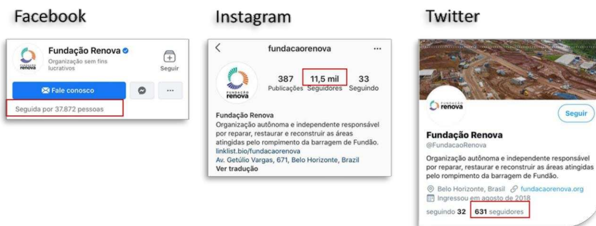
Figura 1 – Redes Sociais Virtuais da Fundação Renova