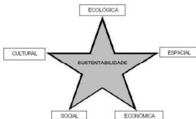
Figura 1 – Formas de sustentabilidade

A Sustentabilidade Social está relacionada com uma distribuição de renda mais igualitária entre a sociedade, com propósito de reduzir a diferença entre o padrão de vida de pessoas com muito dinheiro e pessoas com pouco dinheiro;