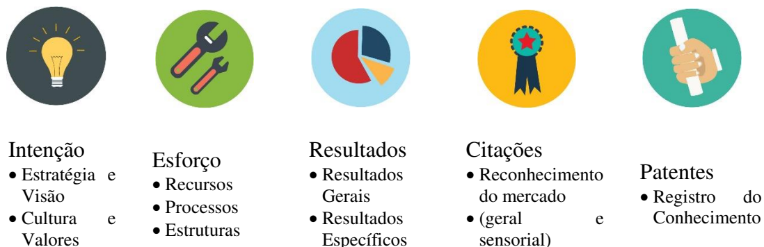
Figura 1 - Pilares metodológicos do Prêmio Valor Inovação Brasil

estratégica da PWC. Este prêmio tem como objetivo avaliar as práticas de inovação das companhias que atuam no Brasil em diferentes atividades econômicas (STRATEGY&, 2019). A metodologia de avaliação das empresas participantes tem como base cinco pilares: intenção de inovar, esforço para realizar a inovação, resultados obtidos, avaliação do mercado e geração de conhecimento.