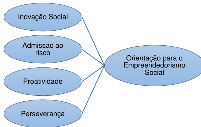
Figura 3 – Orientação Empreendedora Social e Perseverante.