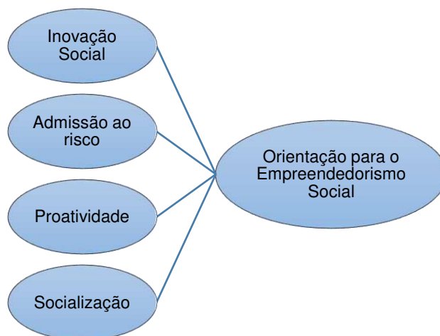
Figura 1 – Dimensões de uma Orientação para o Empreendedorismo Social

oportunidades de mercado em uma tentativa deliberada de competir com outras empresas. (MILLER, 1983, 2011).