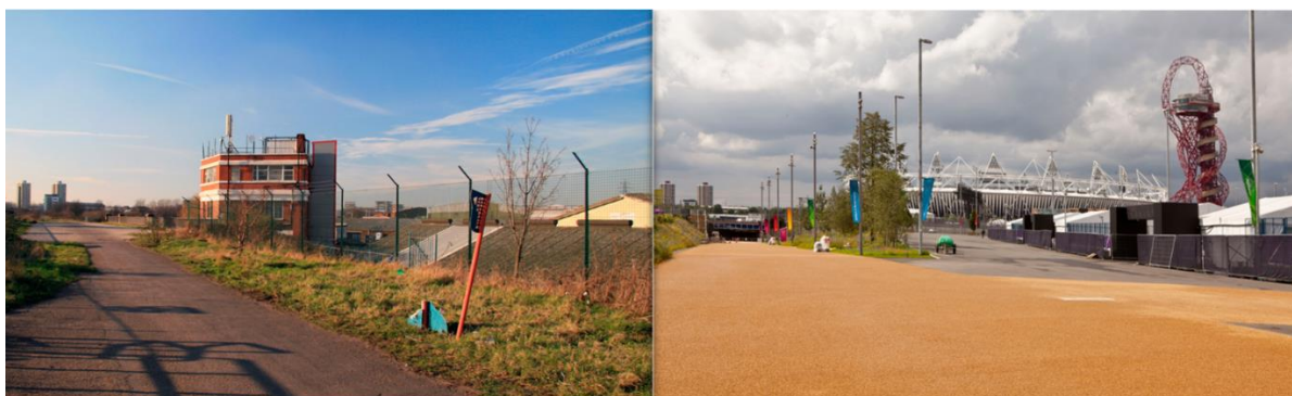
Figura 3. Uma vista da região do Parque Olímpico em 2007 e em julho de 2012.

Por fim, outro ponto levantado a respeito desse tipo de megaprojeto, é o processo de gentrificação 6 , que de acordo com ALCÂNTARA (2018), consiste em “...processos de mudança das paisagens urbanas, aos usos e significados de zonas antigas e/ou populares das cidades que apresentam sinais de degradação física, passando a atrair moradores de rendas mais elevadas”. Em um artigo publicado pelo New York Times (New York Times, 2018) a região ainda apresenta uma das maiores taxas de desabrigados de Londres e apresentou uma valorização muito rápida dos imóveis o que inviabilizou os custos para a classe trabalhadora.