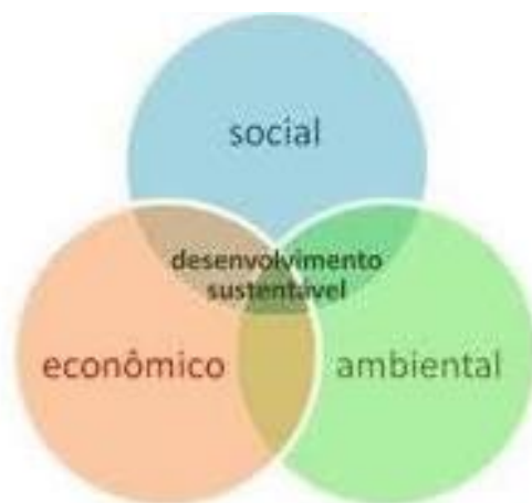
Figura 1: Triple Bottom Line (TBL)

Nesse sentido com o conceito do Triple Bottom Line (TBL), criado por John Elkington em 1997, que leva em conta os eixos econômico, social e ambiental, existe uma necessidade de se construir uma gestão pública pautada no desenvolvimento sustentável, como apresentado na figura 1.