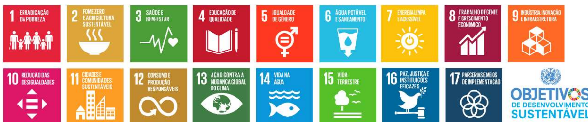
Figura I – Os 17 objetivos para o desenvolvimento sustentado.

Frente aos inúmeros desafios e impactos ambientais globais, Os Objetivos de Desenvolvimento Sustentado (ODS) estipulam 169 metas categorizadas em 17 objetivos que buscam a procura da concretização dos direitos humanos, estes integrados e indivisíveis, equilibrando as três dimensões do desenvolvimento sustentado preconizado pelo Triple Bottom Line . Se refere a ações nas grandes áreas, mas também com esforços integrados que propiciem com que as empresas, por adotarem práticas sustentáveis, possam gerar o desenvolvimento econômico, riquezas para a sociedade e seus investidores. Um depende de outro, para manter a o desenvolvimento harmônico da Sociedade.