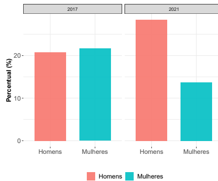
Figura 2: Proporção de indivíduos em situação de pobreza por sexo

homens também tenham recebido auxílios financeiros, estes foram inferiores aos recebidos pelas mulheres. Por exemplo, o Projeto de Lei (PL) nº 2099/20 8 foi criado para garantir um auxílio temporário, no valor de R$ 1.200, às mães solteiras que eram as únicas provedoras de sua família e que estavam em situação de vulnerabilidade social.