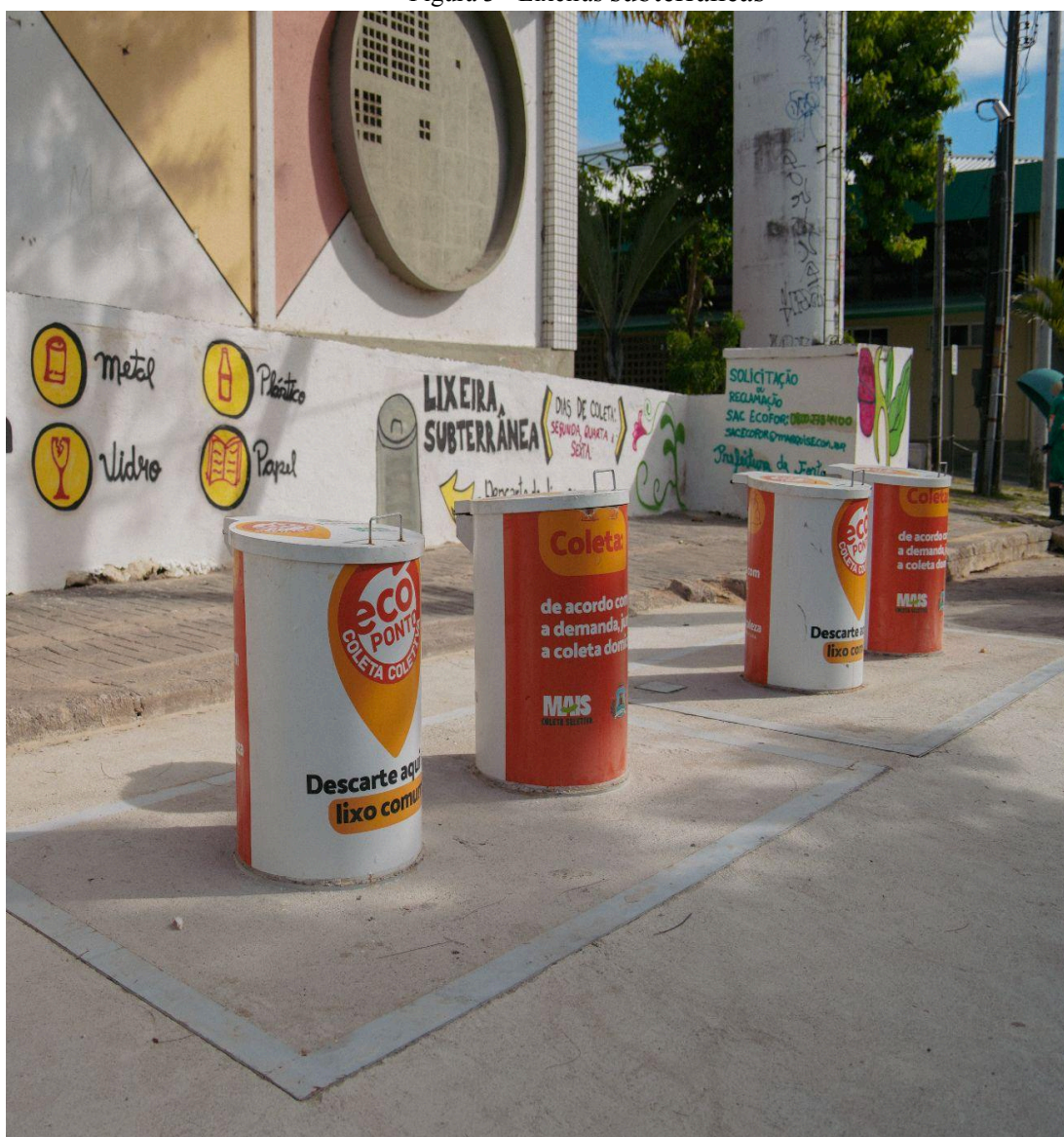
Figura 3 - Lixeiras subterrâneas

Além da expansão da Rede de Ecopontos, Fortaleza vem incorporando equipamentos urbanos inovadores voltados à eficiência da coleta e ao estímulo à participação cidadã na separação dos resíduos. Entre esses equipamentos, destacam-se as lixeiras subterrâneas (Figura 3), instaladas em locais de grande circulação, como praças e áreas comerciais. Esses sistemas possuem contentores de grande capacidade instalados no subsolo, reduzindo odores, evitando o acúmulo de resíduos na superfície e contribuindo para a melhoria paisagística e sanitária dos espaços públicos. A adoção desse modelo, já consolidado em cidades europeias, reforça o compromisso do município com soluções urbanas compactas e sustentáveis (Fortaleza, 2022).