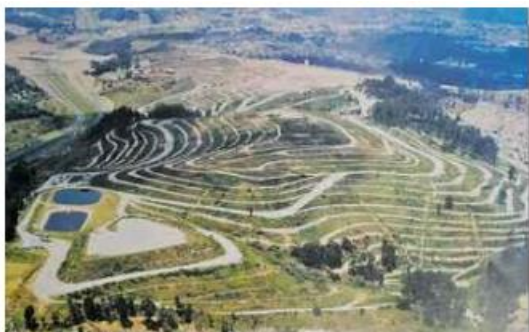
Figura 2 - Aterro Vila Albertina

A empresa realiza 5 tipos de coleta sendo elas, Coleta Comum, Coleta Reciclável, Coleta Mecanizada de Superfície e Subterrânea, Coleta em Comunidades, Coleta de Resíduos de Serviços de Saúde, tendo seu descartes no aterro da Vila Albertina e Bandeirantes que são apresentados na Figura 2 e 3 abaixo (LOGA,2022).