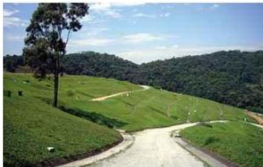
Figura 3 - Aterro Bandeirante