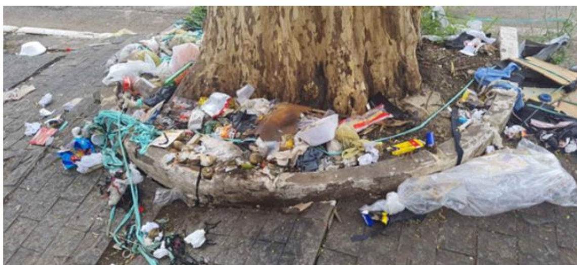
Figura 14 - Registro da Rua Pedro Vicente dia 16/05