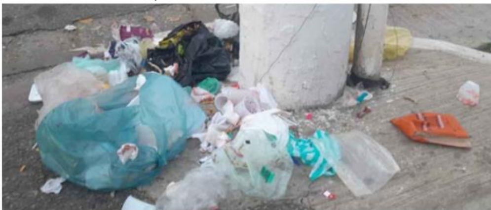
Figura 9 - Registro da Rua Pedro Vicente dia 11/05

Essa incoerência entre o previsto e o executado torna-se ainda mais evidente ao se observar as próprias ações descritas no PGIRS. O plano de 2012, contém medidas modernizadas como contêineres subterrâneos tecnológicos que foram implementadas na Avenida Faria Lima (Prefeitura de São Paulo, 2012), uma área de grande valorização urbana, que evidencia uma concentração de investimentos em regiões centrais e de maior visibilidade, enquanto bairros com população vulnerável e graves problemas de descarte, seguem desassistidos, evidenciando uma gestão mais preocupada com a estética de espaços valorizados em detrimento da efetividade socioambiental. Já na versão atualizada de 2014 reforçou essa diretriz ao destacar a coleta containerizada e seletiva como medida essencial para a universalização do serviço e melhoria da limpeza urbana (Prefeitura do Município de São Paulo, 2014). Entretanto, a Rua Pedro Vicente permanece desprovida destes equipamentos urbanos, revelando grande desigualdade e falta de planejamento urbano, conforme as Figuras 9 a 14.