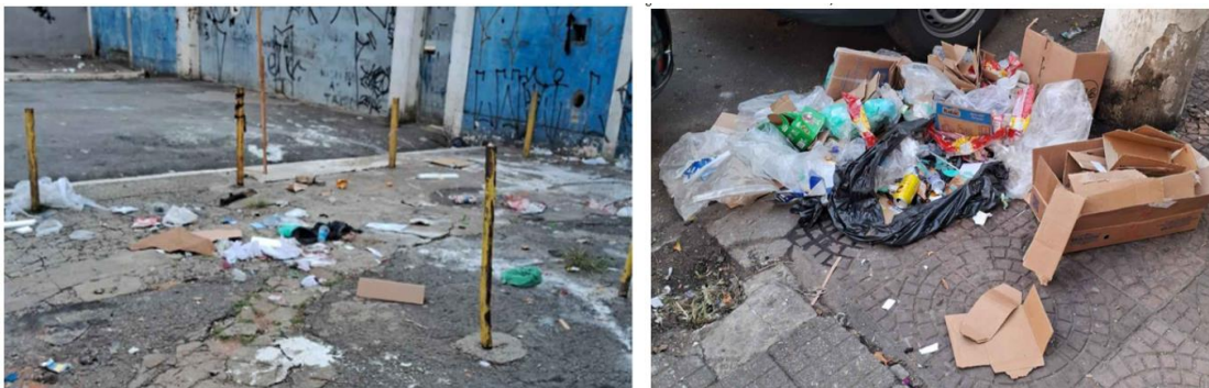
Figura 10 e 11 - Registro da Rua Pedro Vicente dia 12/05 e 13/05