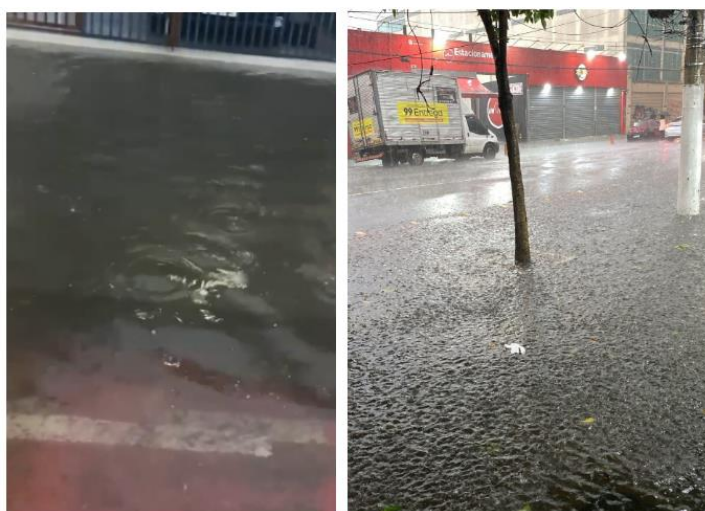
Figura 7 e 8 - Alagamento na Rua Pedro Viciante.