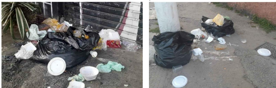
Figura 12 e 13 - Registro da Rua Pedro Vicente dia 14/05 e 15/05