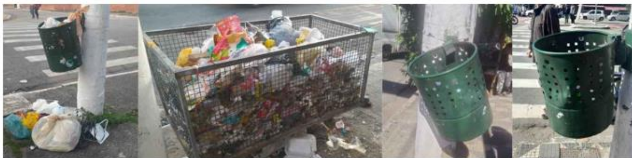
Figura 6 - Ausência de estrutura adequada para o descarte de resíduos

a Resolução nº 275/2001 (Brasil, 2001). O Conselho Nacional do Meio Ambiente (CANOMA), órgão responsável por estabelecer normas e diretrizes ambientais no Brasil. Essa resolução define um código de cores para facilitar a coleta seletiva, como azul para papel, vermelho para plástico, verde para vidro e amarelo para metal, entre outros. Além disso, diversos pontos, é possível observar o acúmulo de lixo ao redor de postes e calçadas, o que acaba comprometendo a higiene urbana e evidencia desafios na aplicação efetiva da política de gestão integrada de resíduos.