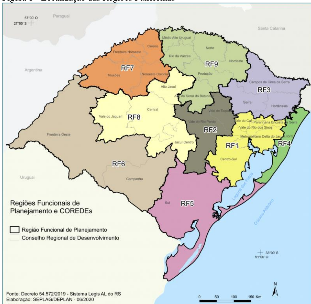
Figura 1 - Localização das Regiões Funcionais

e Gestão, que agrupa os 28 COREDEs com base em critérios socioeconômicos e em dinâmicas de polarização regional. A figura 1 apresenta a localização das RFs.