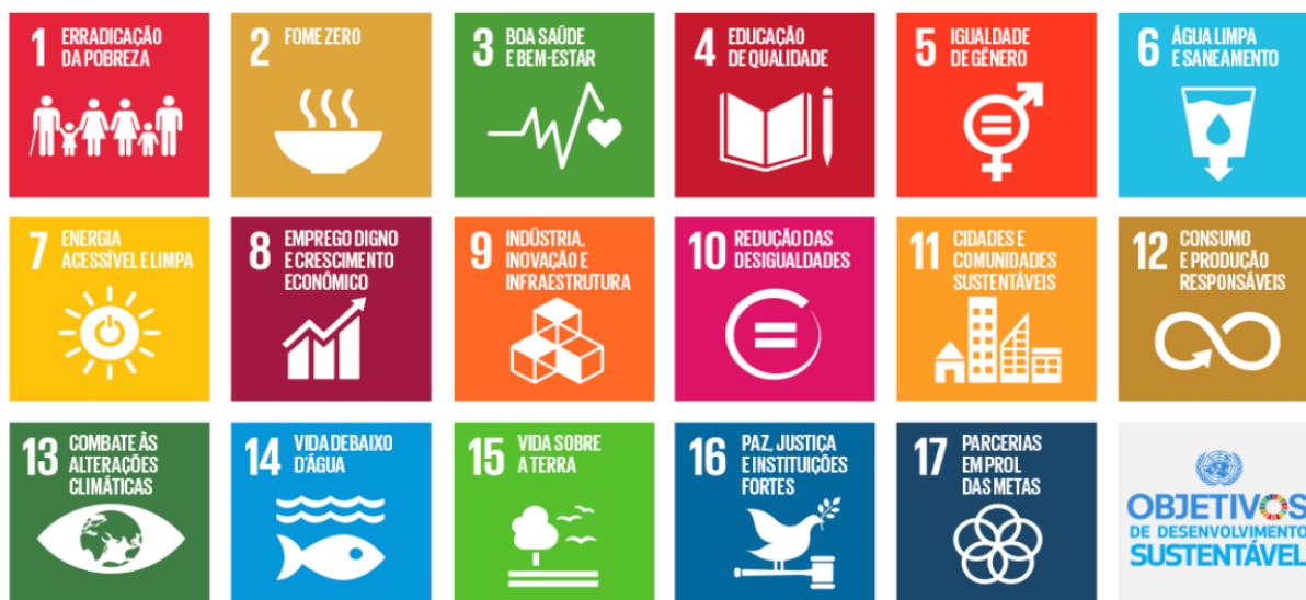
Figura 1 – Objetivos de Desenvolvimento Sustentável (ODS).

Primeiramente, foi realizado a definição do escopo e identificação das dificuldades relacionados a aplicação da metodologia ágeis, a qual se fundamenta nas metodologias e frameworks ágeis apresentados no capítulo referente ao estado da arte. Tanto o evento quanto a proposta têm como objetivo gerar impacto positivo na sociedade. Na Figura 1, são apresentados os Objetivos de Desenvolvimento Sustentável da Organização das Nações Unidas, inicialmente ilustrados em seus 17 eixos.