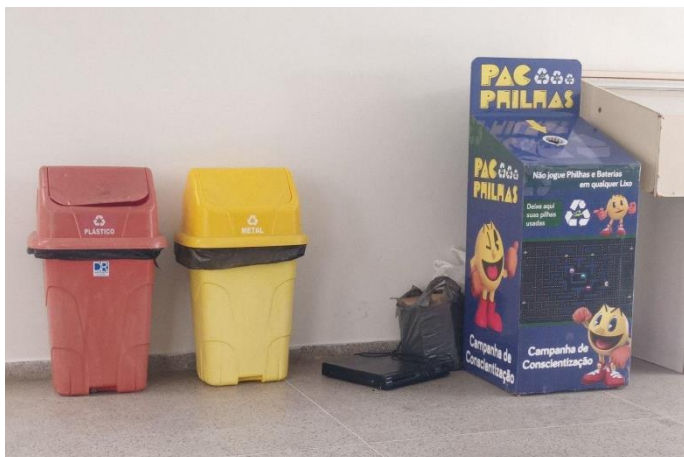
Figura 4 - Coletor de pilhas e baterias

gradativamente substituídas por lâmpadas de LED. Já as pilhas e baterias são armazenadas em um coletor instalado no campus, um projeto também de um dos professores, e a coleta é realizada por uma empresa de Campina Grande.