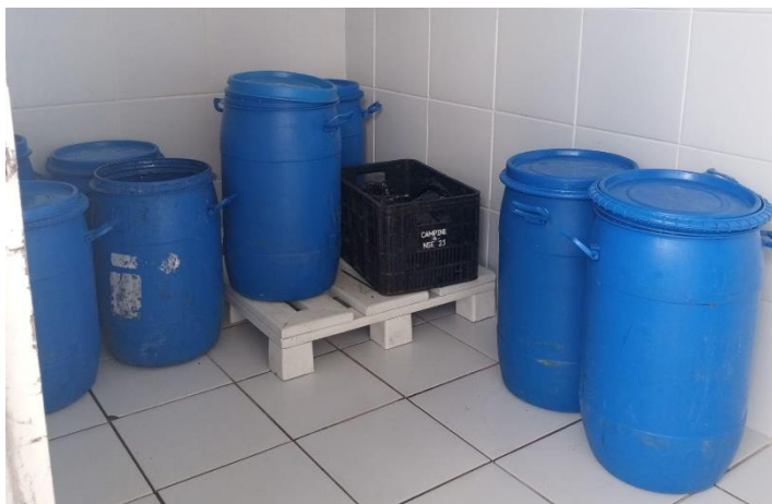
Figura 3 - Armazenamento de resíduos orgânicos do restaurante