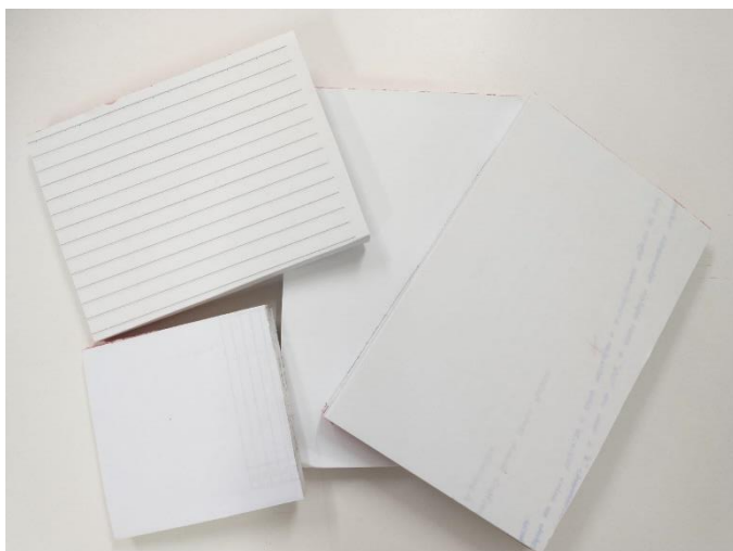
Figura 2 - Bloquinhos feitos com papel reaproveitado

Algumas iniciativas, por exemplo, incluem imprimir frente e verso para aproveitar melhor o papel ou, quando se faz uma cópia em maior número, utilizar o formato de livreto para economizar. De acordo com CR2, existe um projeto de restauração de livros no campus, mas que enfrenta a falta de equipamentos específicos, como um liquidificador industrial para trituração do papel. Atualmente, o trabalho é feito de maneira bastante artesanal, incluindo a encadernação de livros. Além disso, há outras iniciativas por parte dos próprios técnicos, como o projeto liderado por CR2, que envolve o reaproveitamento de folhas usadas apenas de um lado para fazer bloquinhos de rascunho, que são distribuídos para todos os setores do campus (Figura 2). Diante do exposto, as ações reveladas são um esforço alinhado ao segundo indicador proposto por Tavares (2020), o programa para reduzir o uso de papel e plástico no campus.