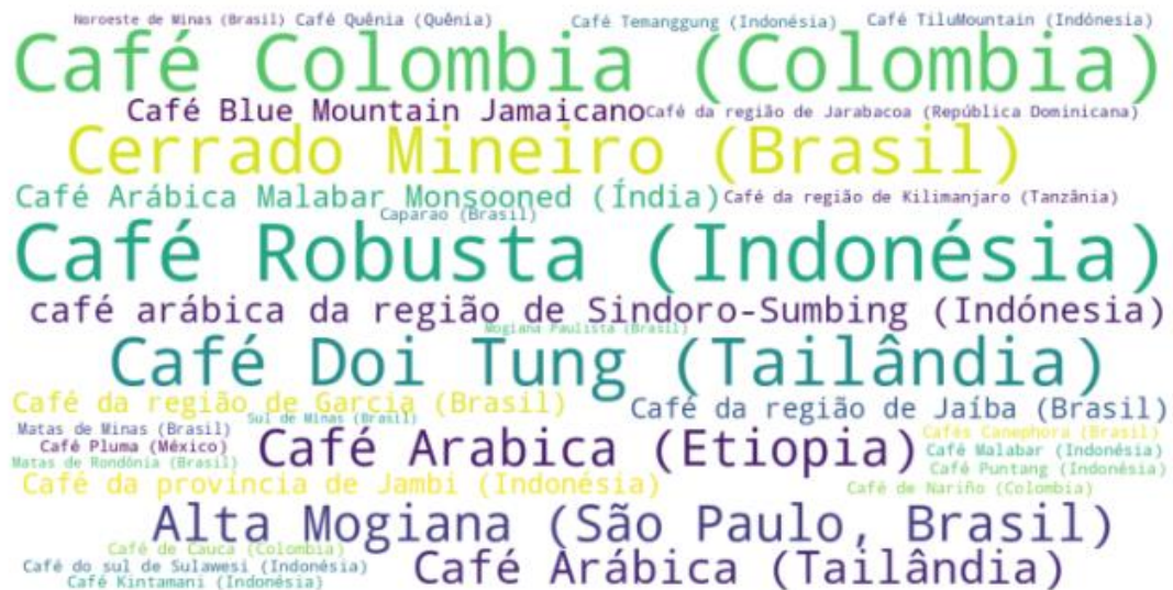
Figura 3 – Cafés com indicação geográfica analisados nas pesquisas