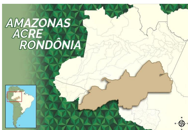
Figura 1 – Mapa da área do projeto AMACRO