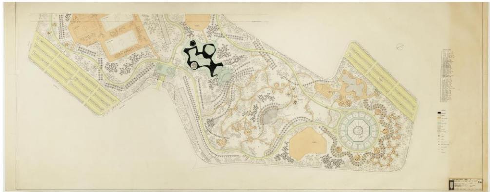
Figura 2 - Croqui detalhado do Parque Moça Bonita, destaque para os diferentes equipamentos naturais e urbanos dispostos no projeto